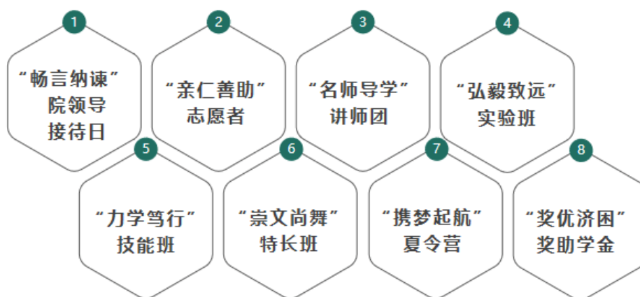
图：八大素质拓展体系

3.3.2 校园文化建设。坚持“用心做教育，用爱育人才”，构建符合学生个性特点和需求的“八大素质拓展体系”及“一月一主题”和“五育”计划的校园文化建设育人体系。